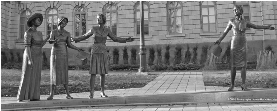
CCNQ | Photographe : Anne-Marie Gauthier

La Journée internationale des femmes est un moment propice pour souligner les réalisations des femmes impliquées à tous les niveaux de la société. Sous la thématique « féministe tant qu'il le faudra », cette journée est également l'occasion de mettre en lumière les enjeux liés à la discrimination et aux iniquités socioéconomiques qui demeurent encore aujourd'hui des freins à l'atteinte de l'égalité entre hommes et femmes.